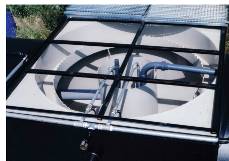
Particolare della griglia e del sedimentatore

Per il corretto posizionamento è necessario costruire una platea di cemento perfettamente orizzontale ed un pozzetto in uscita dell'acqua depurata onde consentire il prelievo ed il controllo da parte delle autorità competenti.